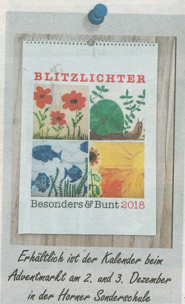
Erhältlich ist der Kalender beim Adventmarkt am 2. und 3. Dezember in der Horner Sonderschule